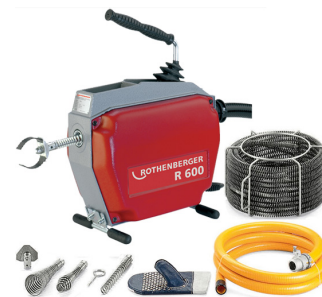
Máy thông tắc đường ống lò xo