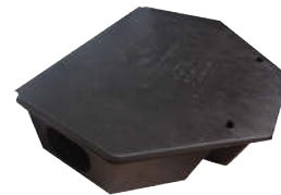
Hộp đựng bả