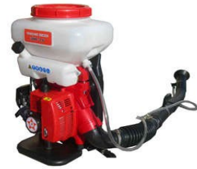
Máy phun hạt mịn MD (Honda-Japan)