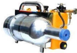
Máy phun sương