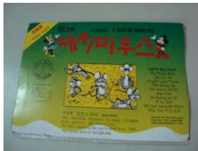
Bẫy dính Glue - trap