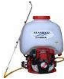
Máy phun sương (Honda – Japan)