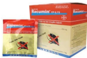
Bả Racumin (Bayer - Đức)