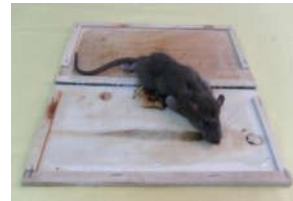
Bẫy dính gỗ - PCS