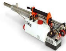
Máy phun nhiệt Fog