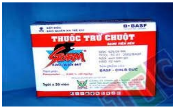
Bả Storm (BASF - Đức)