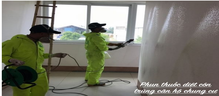
Phun tồn lưu

+ Xử lý tồn lưu : Sử dụng thiết bị phun tồn lưu hóa chất dọc theo tường và những nơi ẩn nấp của côn trùng, giúp tiêu diệt tức thì côn trùng và hóa chất cũng có tác dụng tồn lưu một thời gian trên các bề mặt đã xử lý giúp tiêu diệt côn trùng khi chúng đậu, bò qua khu vực này.