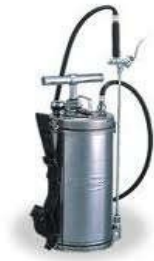
Bình phun tồn lưu (Samco – Japan)

Bằng hệ thống máy móc hiện đại phù hợp với điều kiện công trình và môi trường Việt Nam, chúng tôi tin tưởng rằng sẽ đem lại cho Quý khách hàng sự thỏa mãn tối đa đối với các dịch vụ của chúng tôi cung cấp.