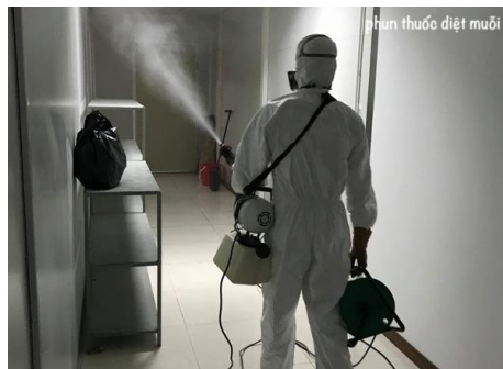
Phun sương ULV

+ Xử lý không gian : Sử dụng thiết bị phun sương hoặc phun mù nóng để tiêu diệt côn trùng đang bay. Thuốc được đưa vào không gian thông qua hệ thống đốt nóng, hạt thuốc theo khối lượng trong không gian, côn trùng hô hấp sẽ bị tê liệt và rơi xuống sàn, trong khi sàn đã được xử lý thuốc do đó hoàn toàn có thể tiêu diệt côn trùng trưởng thành ngăn chặn được sự lây lan quần thể côn trùng.