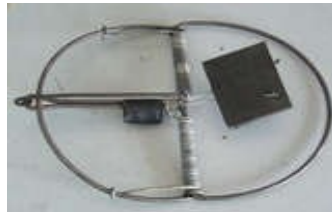
Bẫy bán nguyệt