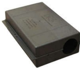
Hộp đựng bẫy