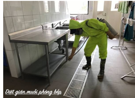
Phun khói xuống cống rãnh